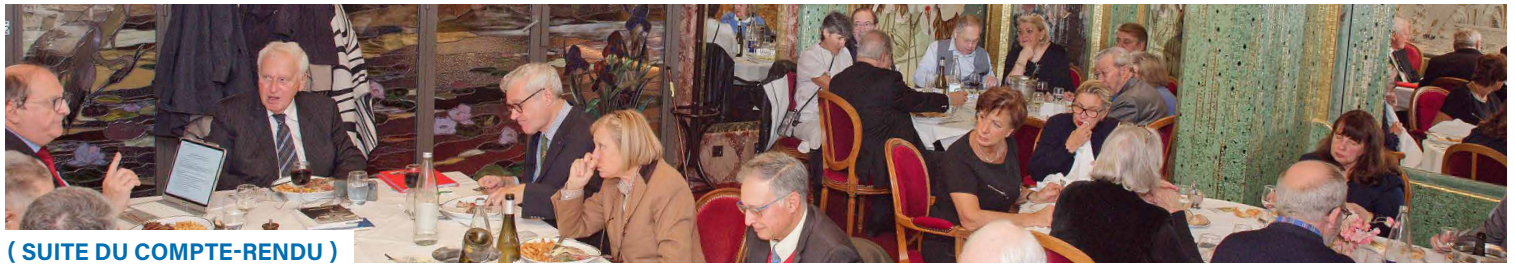
( SUITE DU COMPTE-RENDU )

Pour conclure, nous avons décidé un changement d'organisation : au lieu de se réunir le soir et d'aller au restaurant après qui ne répondait plus aux attentes des membres du club, nous avons préféré organiser un déjeuner et le samedi. La forte mobilisation des membres du club aux deux déjeuners organisés le samedi midi a souligné l'accroissement du nombre de participants y compris venant de province.