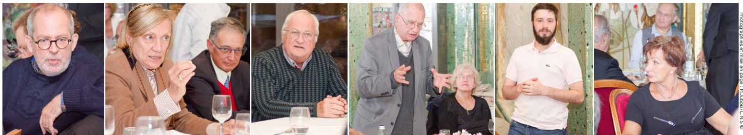
Photographies et titres en page - Photo: CNS ©

Pour conclure, le Club Nouveau Siècle doit contribuer à changer l'état d'esprit et aboutir à ce que le gouvernement, avec un gaulliste à l'intérieur crée un cadre en acceptant des formules diverses plus participatives. Le président remercie tous les participants et clos la réunion à 15h45. ■